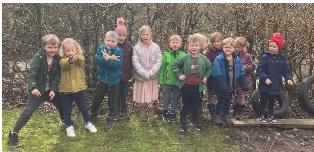
Skønne maxibørn klar til påskejagt ❤️

Rigtig god og glædelig påske til jer alle når I kommer så langt 🐣 🐣 🐣